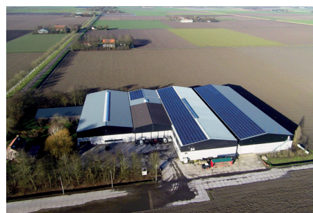
Bedrijf Espelerweg Emmeloord

Eigen gewicht is dus een belangrijke reden om te kiezen voor een getrokken rooier. Deze moet natuurlijk dan wel voldoen aan een aantal eisen, De Grimme SV 260 voldoet hieraan omdat: De bunker heeft een terugdraaiende bunkerbodem (patent Grimme), is dus supersnel leeg te draaien en is zeer productvriendelijk. De machine was geheel volgens de wensen van gebroeders de Zeeuw samen te stellen met Vario-RS (patent Grimme) en MultiSep, wielaandrijving en andere belangrijke zaken. Om de capaciteit nog meer te vergroten is een Grimme RL 400 aangeschaft om vanaf dit jaar de keus te hebben tussen zwadrooien, om zo de aardappelen op te laten drogen of om 4 rijen tussen de ruggen af te leggen om zo 6 rijen tegelijk te rooien. Bij één van de SV 260's is daarvoor de voorbereiding (halve diabolos en middenopname) aangeschaft om ook dit mogelijk te maken.