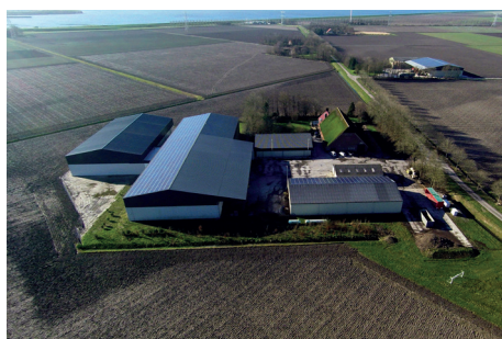
Bedrijf Sluitgatweg Nagele

Om bodemverdichting tegen te gaan willen we zo weinig mogelijk met kippers op het land komen. Er zijn dan wel zelfrijders met bunker tot 15 ton inhoud maar volgens de Zeeuw zijn deze veel te zwaar en dat kan men in het najaar/winter zien aan de hoeveelheid water wat op het land blijft staan op de plaatsen waar zo een zware machine heeft gelopen.